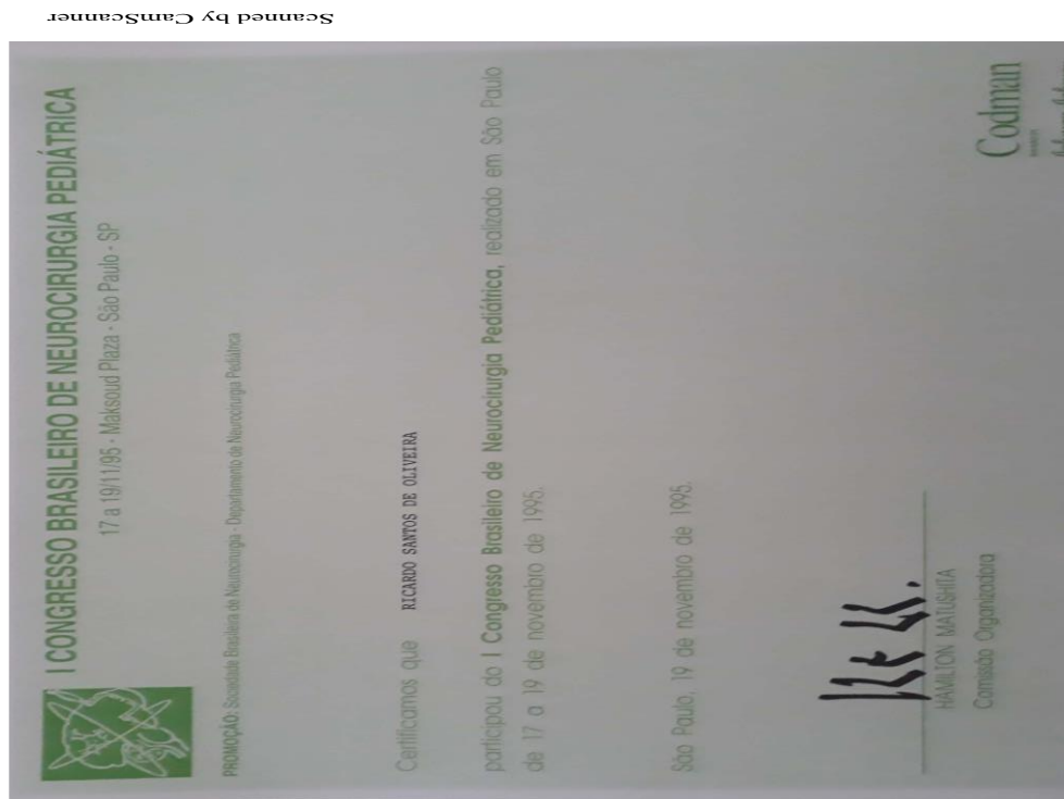
Fig.1 Certificado I Congresso Brasileiro de Neurocirurgia Pediátrica