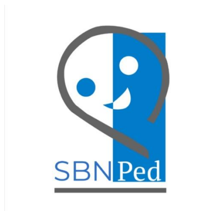
Fig. 5 Identidade visual da SBN-Ped (período de 2001 -2019)

O logotipo da SBN-Ped representou um período importante de estruturação da Sociedade (Fig. 5). Em 2018, após o registro oficial do Estatuto, na cidade de Recife a SBN-Ped torna-se uma entidade jurídica oficialmente reconhecida.