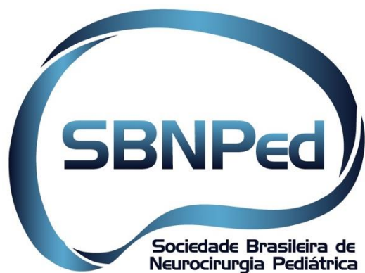
Fig. 6 Identidade visual da SBN-Ped.

Em 2019, foi feita uma consulta a um escritório de logomarcas. O design gráfico é uma das indústrias mais dinâmicas e mutáveis, especialmente quando se trata de logos. Ao analisar uma logomarca algumas orientações são importantes: 1) símbolos claros e objetivos; simplificação da forma; letras e cores. A combinação de texto conciso e claro com uma figura geométrica simples é considerada uma tendência de logo moderno, tornando mais fácil a comunicação visual. Assim, surge uma nova identidade visual da SBN-Ped (Fig. 6).