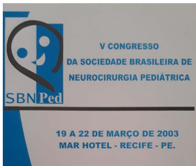
Fig. 4 Identidade visual da SBN-Ped modificada em 2003

Em seguida, durante o “V Congresso Brasileiro de Neurocirurgia Pediátrica”, no ano de 2003, a identidade visual da SBN-Ped tornou-se predominantemente azul e, assim permaneceu até 2019 (Fig.4).